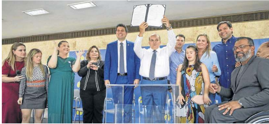
Ibaneis: GDF está trabalhando para melhorar os serviços às pessoas com deficiência

colocar o DF no local que ele merece”, declarou o governador.